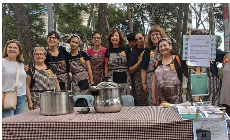
■ Cuineres en un descans

Van començar a servir a les 12 i va finalitzar a les 14 hores. També hi havia un taller de com fer compost a casa. L'accés era totalment gratuït, encara que es podia contribuir amb l'associació veïnal comprant un record de l'esdeveniment.