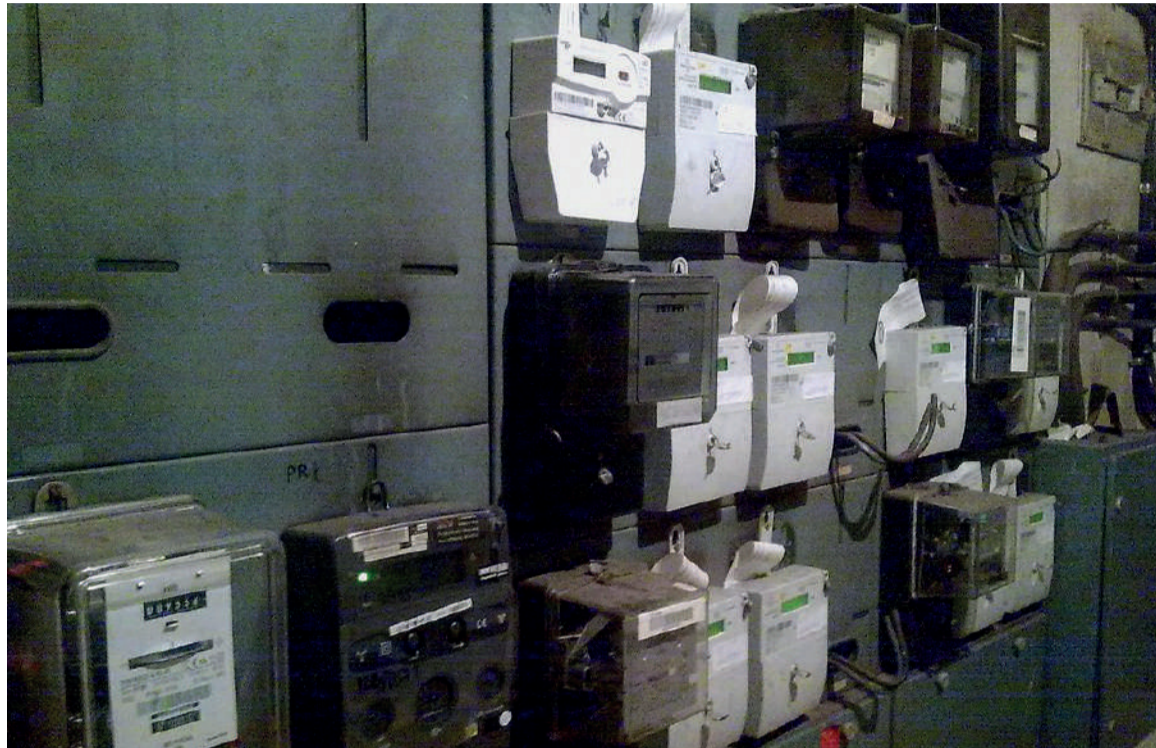
LABLASCOVEGMENU (CC BY 2.0)

1. La ciutadania, en general, està al límit pel patiment constant, degut en aquests moments a l'actual pandèmia i agreujat pels problemes climàtics que han portat fortes borrasques de neu, pluja i gelades.