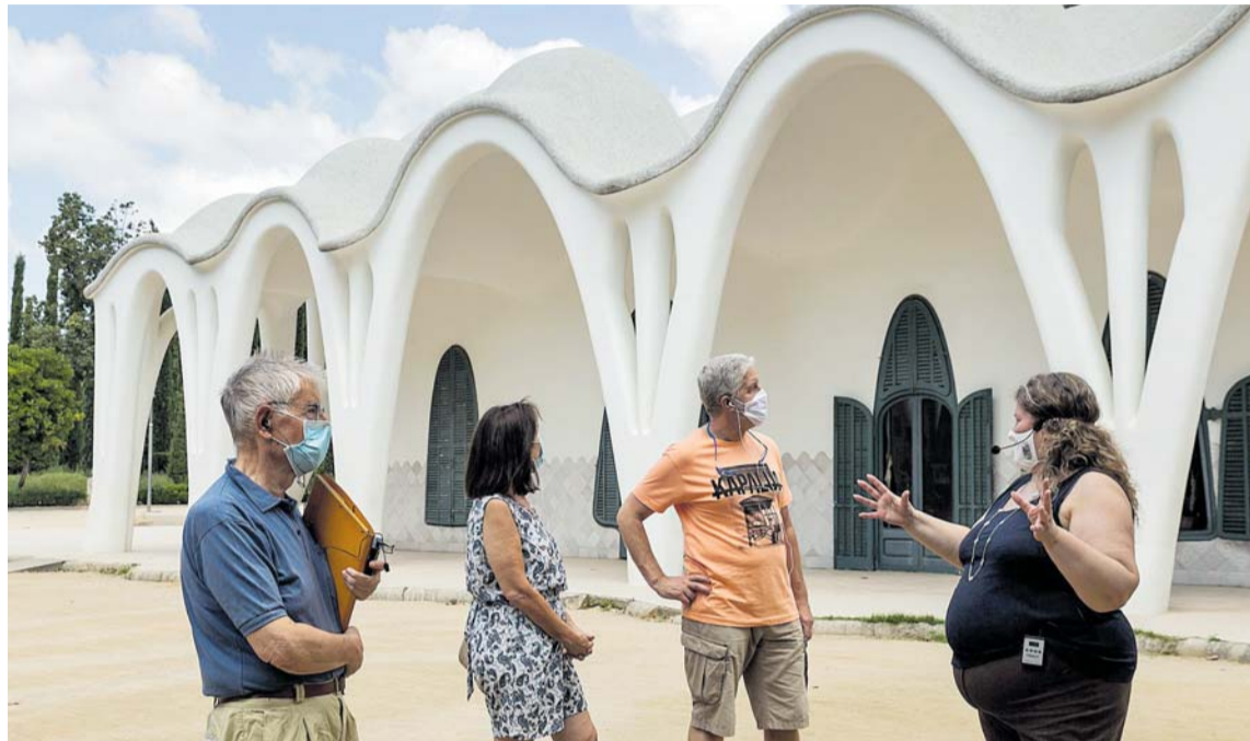
Ahir és van tornar a organitzar rutes i visites guiades. La Masia Freixa va ser un dels escenaris. LLUÍS CLOTET

Han estat programades un total de vuit propostes. Gairebé cada dia, una de diferent. Els dilluns a les deu del matí s'ofereix la ruta pel Parc de Vallparadís i el seu patrimoni. El dimarts a la mateixa hora, i també els dissabtes a les onze, “La Seu d'Ègara, un tresor amagat”. Dimecres, a les 5.30 de la tarda, “Habitatges de la burgesia” (Masia Freixa i Casa