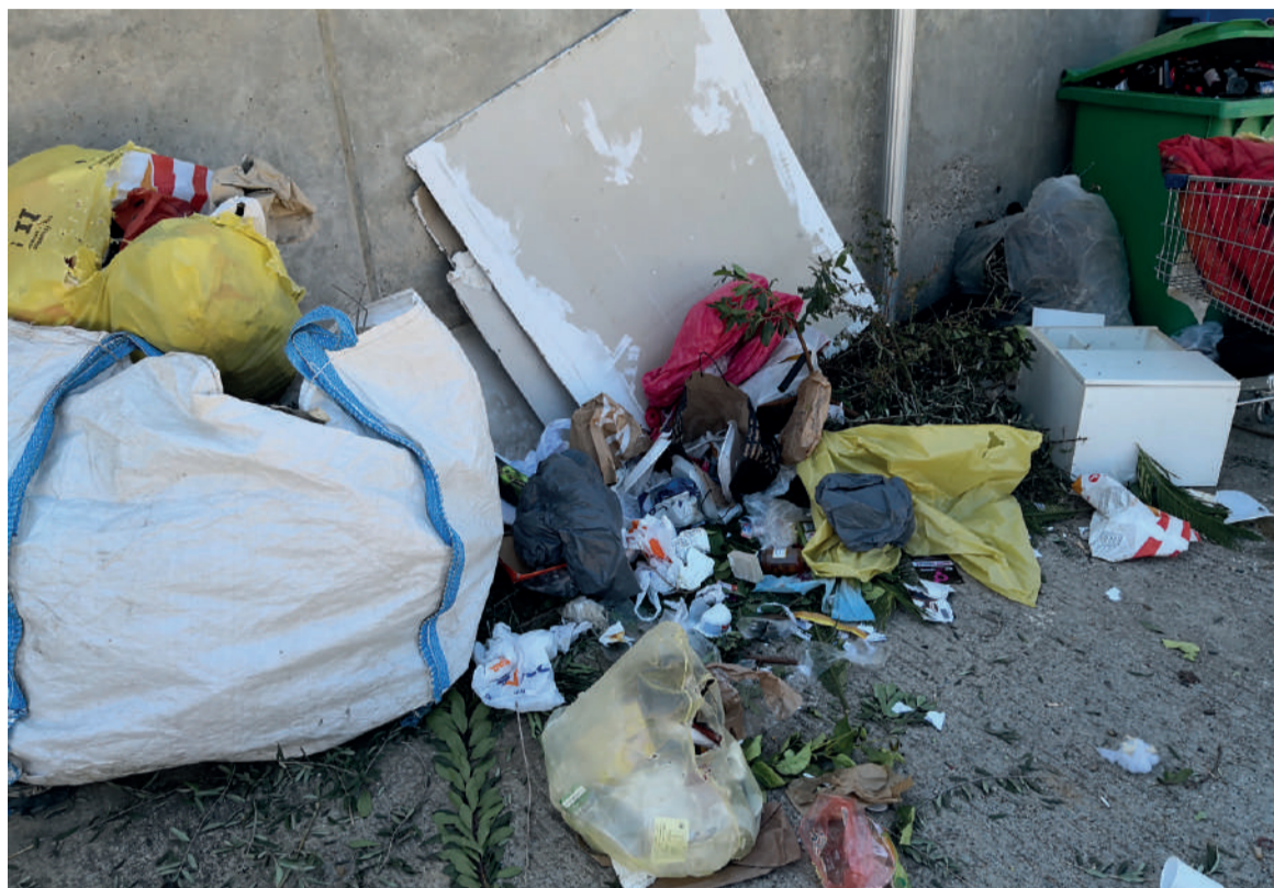
■ Imatges quotidianes de l'estat dels punts de recollida de les escombraries a Les Carbonelles.

I sobretot, l'afartament per un tracte injust respecte als barris del cor de la ciutat. Ho hem de dir alt i clar perquè ja n'hi ha prou d'aquest color. L'extraradi del districte IV també existeix, senyores i senyors de l'ajuntament. És evident que tots els barris de la nostra estimada ciutat es mereixen millorar, en això sempre ens trobaran recolzant als altres barris, perquè la nostra queixa és amb els polítics que any rere any es riuen dels nostres barris en la cara. Es riuen de les Carbonelles i es riuen de les Martines. Sento dir-ho però és així. Portem un llastre que NO hem demanat, des dels anys en què es va urbanitzar Les Martines i misteriosament, bona part dels diners que hi havien destinats a aquesta, es van esfumar, i la tan esperada urbanització va acabar sent un batiburrillo d'irregularitats, carrers mal fets i manca de materials en altres. Perquè ja estem farts d'aquest color, potser hauríem de començar a tocar els nassos, per exem-